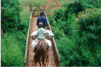
Gestión de proyectos de cooperación internacional

DESOS Opción Solidaria es una entidad sin ánimo de lucro que trabaja para acercar la realidad de los países del Norte y del Sur, creando vínculos de intercambio y de amistad, a través de: