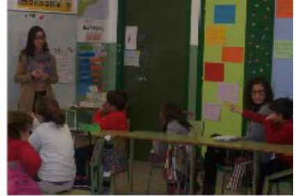
Sensibilización y Educación para el Desarrollo